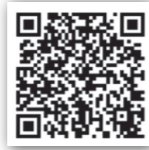
スマートフォン用QRコード